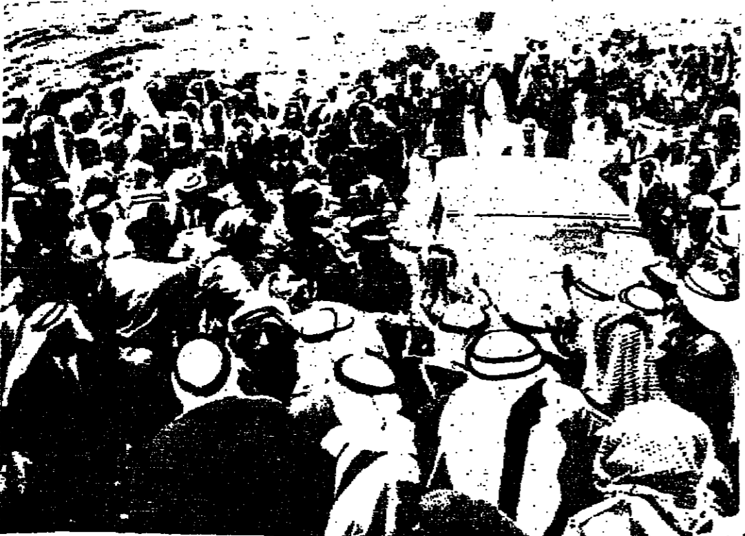
جلالة الملك العظيم لدى وصوله الى الوادي موسى وفي استقباله عدد كبير من شيوخ العشائر والمواطنين تصوير ١٠